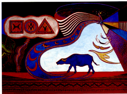
Mystiek van de waterbuffel in de Batakcultuur 2, 2008, gouache en aquarel, 66x48 cm door Marjolijn Groustra

Hun atelier is te bezoeken tijdens de Leidse kunstroute op 27 en 28 september 2008 www.kunstrouteleiden.nl